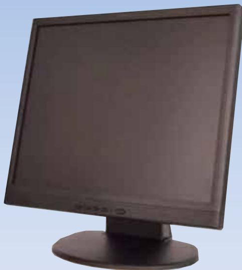
※写真は LDA-215N1 です。

アナログ監視カメラが直接接続できるデスクトップ型LCDモニタ BNC コネクタ付きのLCDモニタ（2系統装備） 各種画像補正機能を搭載（ビデオ入力） 各種安全規格（UL, CE, FCC）をサポート