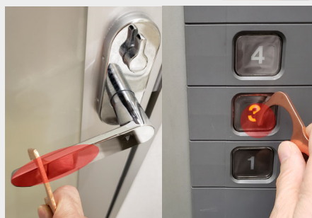
触りたくないドアノブ、つり革 エレベーターのボタンなど