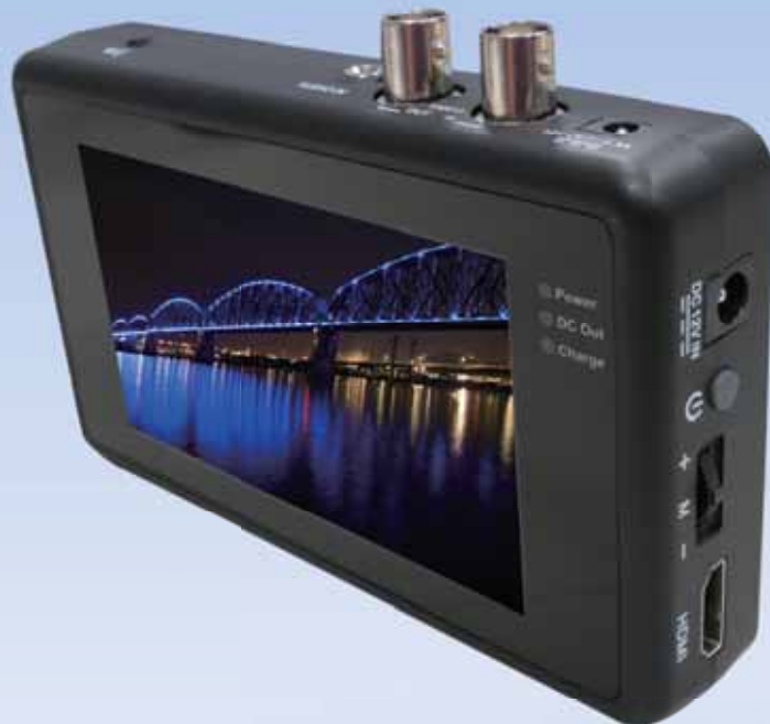
※写真は LDH-143A モデルです。画像はハメコミ合成です。

IP カメラ用・AHD/TVI カメラ用・SDI カメラ用の 3 モデルをご用意 監視カメラ設置時に作業者が手元でカメラ画像を確認できる バッテリー内蔵小型 LCD モニタ